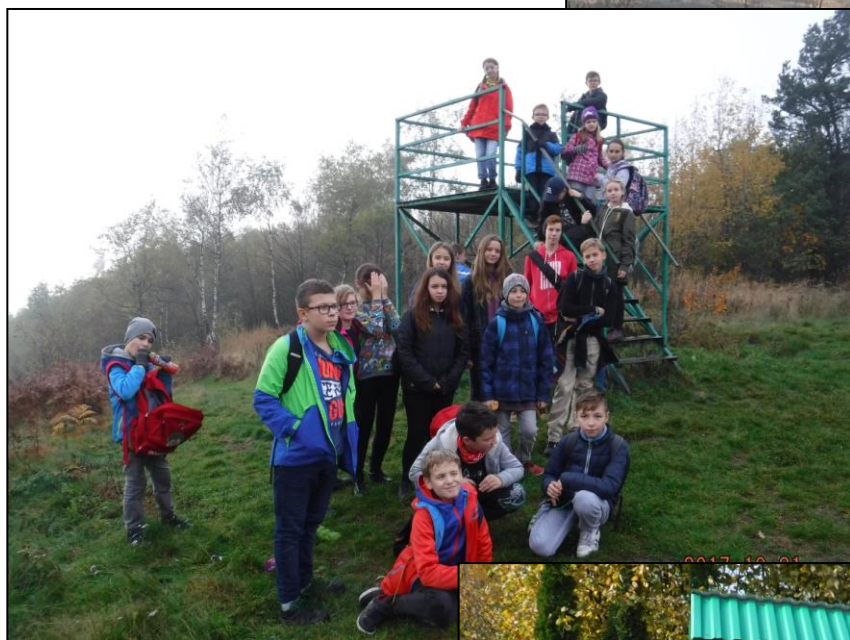
Cel osiągnięty - Klonówka zaliczona....