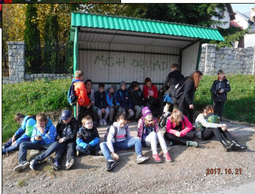
Zmęczeni ale szczęśliwi wracamy do domu.....