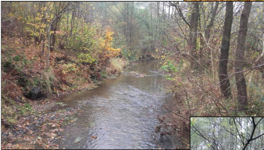
Przełom rzeki Lubrzanki.