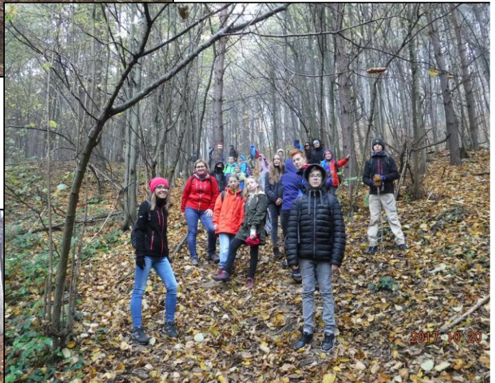
Wszystkim dopisywał dobry humor....