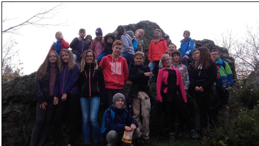
Diabelski Kamień - znowu jest super...