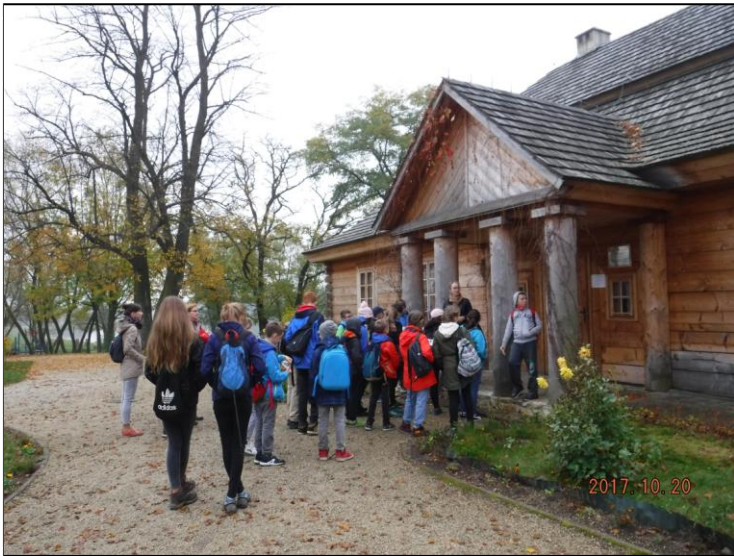
Dworek Stefana Żeromskiego w Ciekotach